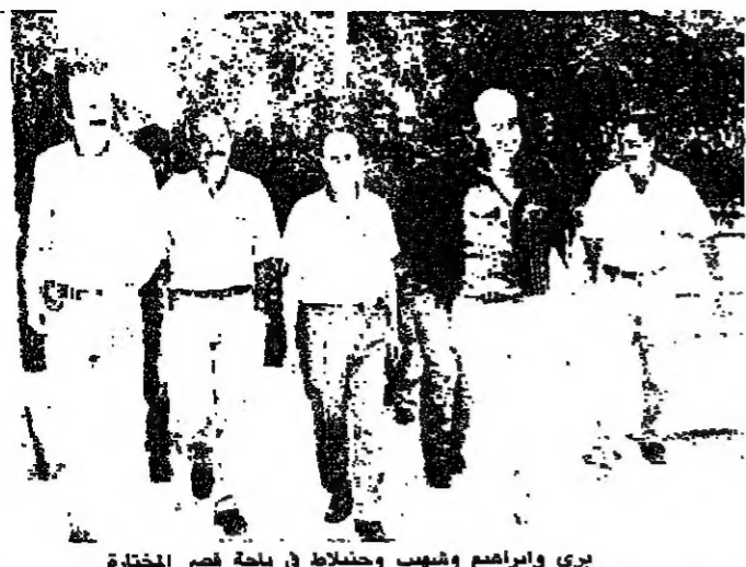
بري و ابراهيم وشبيب و جنبلاط في بلدة فسر المختارة

حضر رئيس الحزب التقدمي الاشتراكي الوزير وليد جنبلاط من اجتاح اسرائيل جديد لبنان. وراى ان الاستفراد بامن الجنوب سيكون متخلا جديدا الى غزو اسرائيل، وطالب بوقف القتال في اقليم التفاح وارسل الجيش الى هناك محملا مسؤولية التلكؤ للشرعية وبعض اوساط الجيش الذين يرفضون ارسال الجيش الى الجنوب.